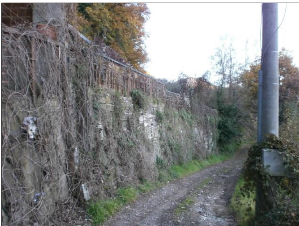
Figura 15: Strada Pierina - Vista su confine Lotto lato strada.