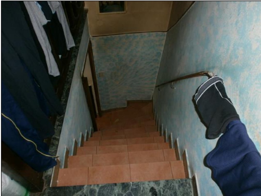
Figura 6: collegamento interno P1/P2