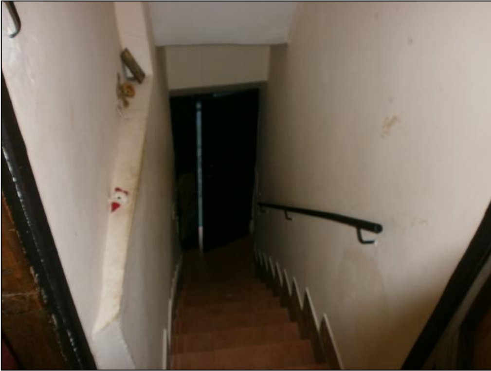
Figura 3: collegamento PT/P1 - accesso