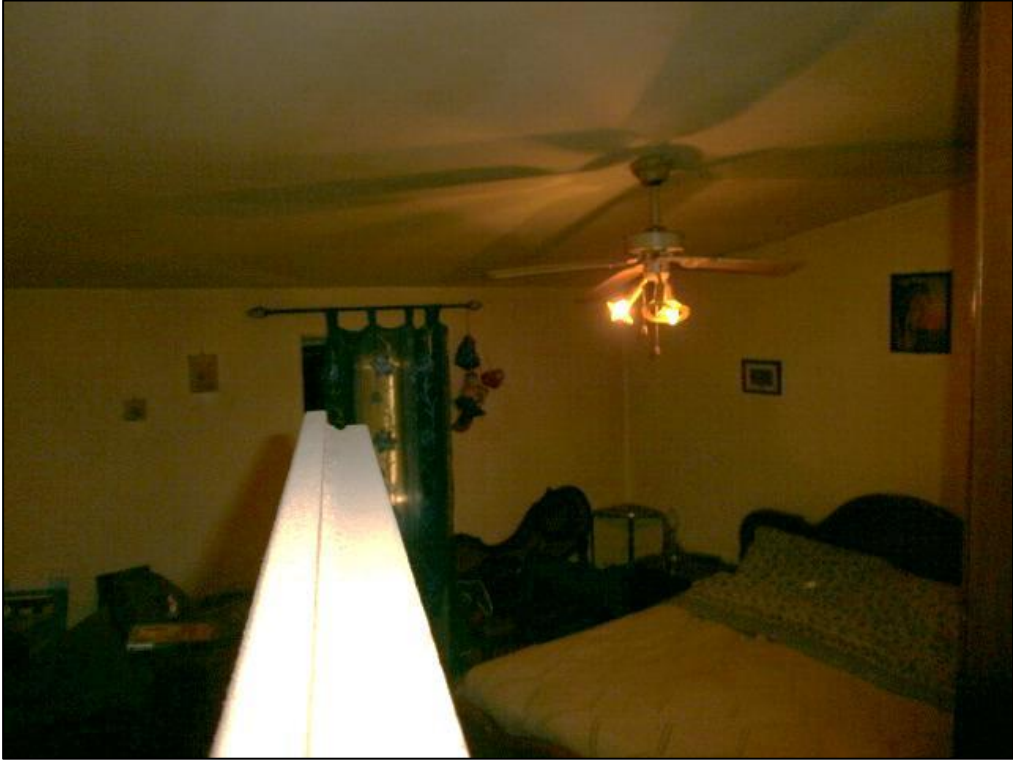
Figura 11: camera - P2