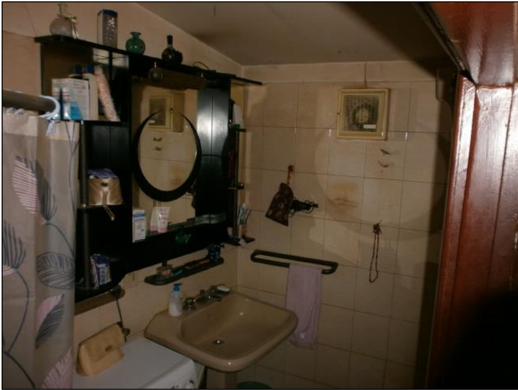
Figura 9: bagno - P2