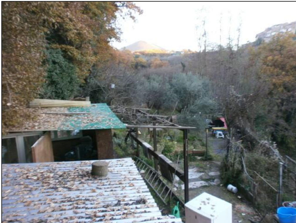
Figura 14: vista interna al Lotto terreno (F.147 mappali 267, 268 – contigui e perimetrati)