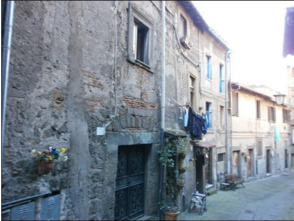
Figura 1: Prospetto

LOTTO_1 – Abitazione – Bagnai a VT – Via Malatesta 30