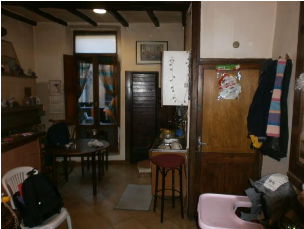
Figura 4: soggiorno/pranzo - P1