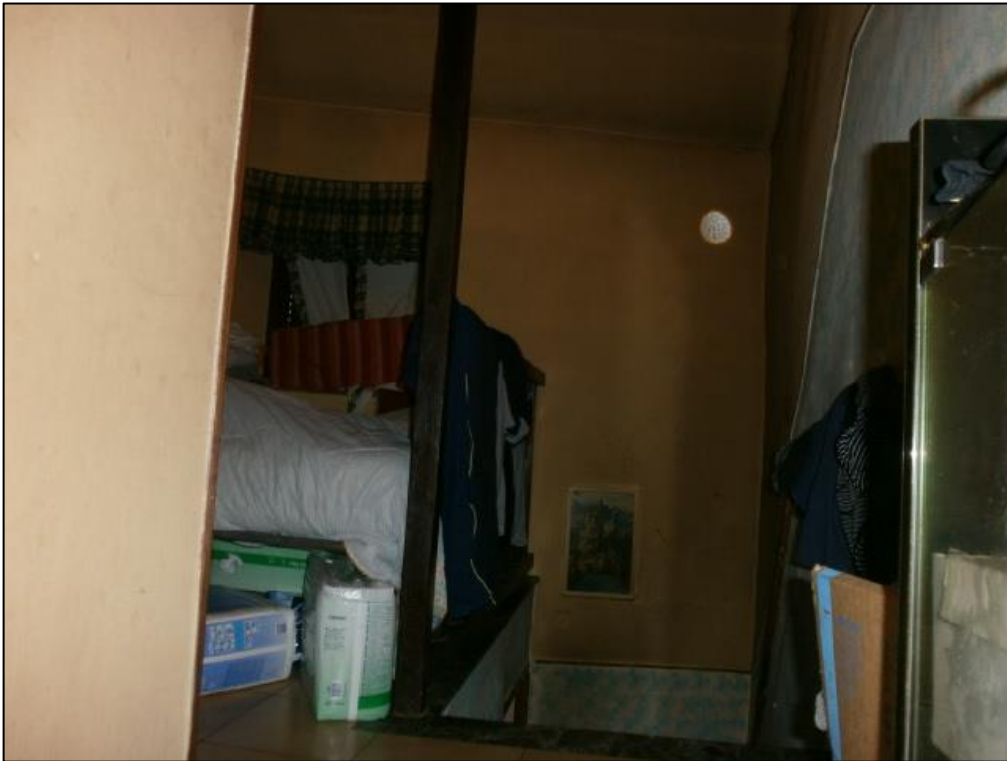
Figura 7: disimpegno - P2