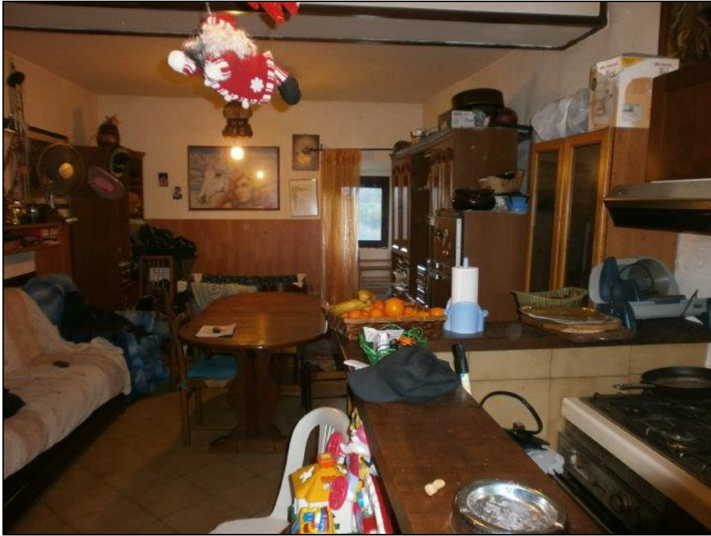
Figura 5: soggiorno/pranzo, angolo cottura - P1