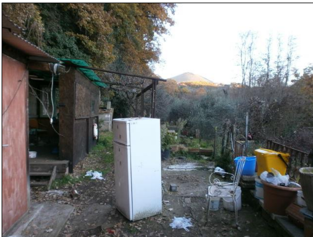
Figura 13: vista interna Lotto terreno (F.147 mappali 267, 268 – contigui e perimetrati)