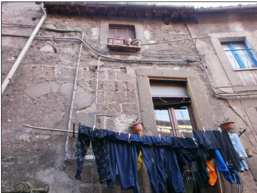
Figura 2: prospetto