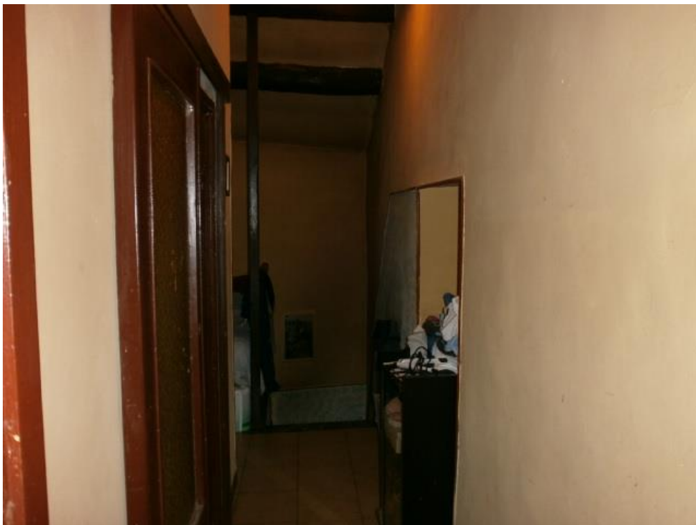
Figura 8: disimpegno - P2