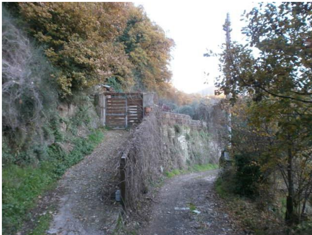
Figura 12: accesso al lotto (F.147 mappali 267, 268 – contigui e perimetrati)